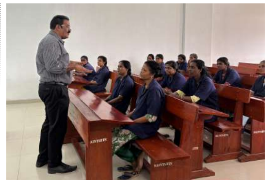
Principal interacting with Kudumbashree Members

Kottayam: On 11th April 2025, the Department of Computer Applications and Artificial Intelligence at Saintgits College of Applied Sciences conducted an Extension Activity titled the Digital Literacy Program. The initiative was aimed at empowering women associated with the Kudumbashree mission by enhancing their digital skills and awareness. The program focused on bridging the digital divide, promoting technology usage, and fostering self-reliance among women through hands-on training and practical sessions, encouraging confidence, inclusion, adaptability, creativity, leadership, and active participation in the growing digital economy.