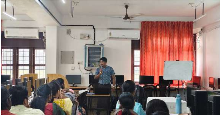
Resource person conducting session on Exploring deep learning